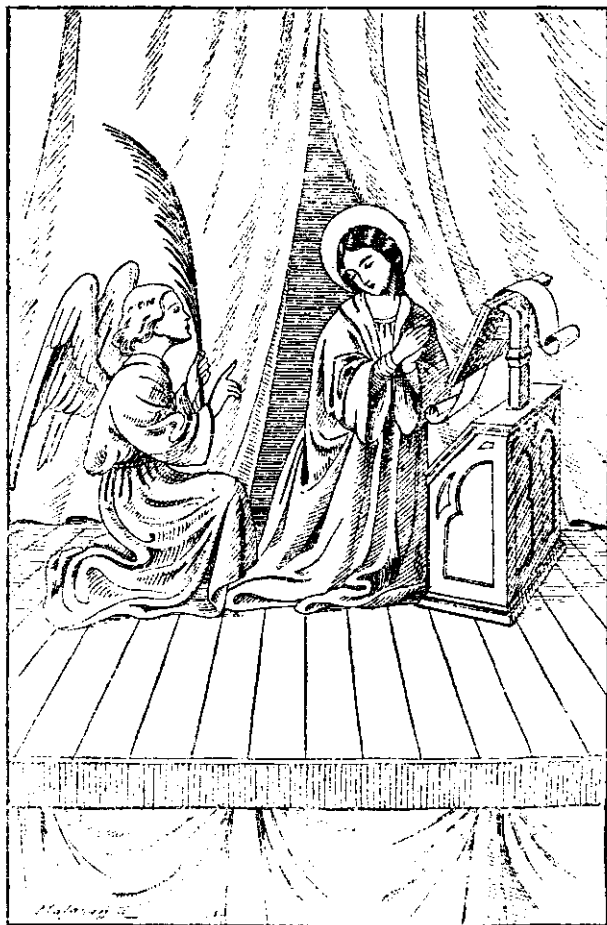
Rreyna de la jerarquía, toma esta preciosa palma.